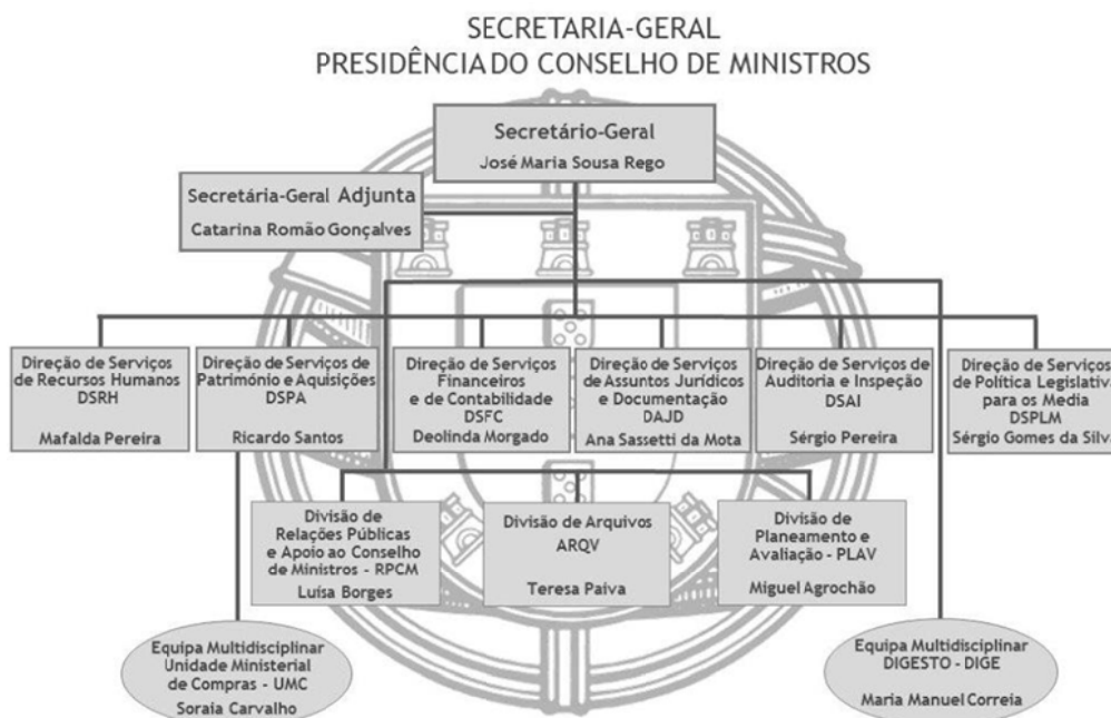
Gráfico 1 - Organograma da SGPCM

Assim, o atual organograma da SGPCM pode ser representado do seguinte modo: